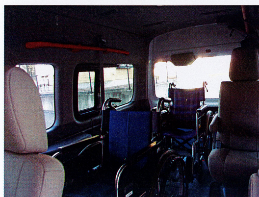
車椅子2台搭乗も可能です。