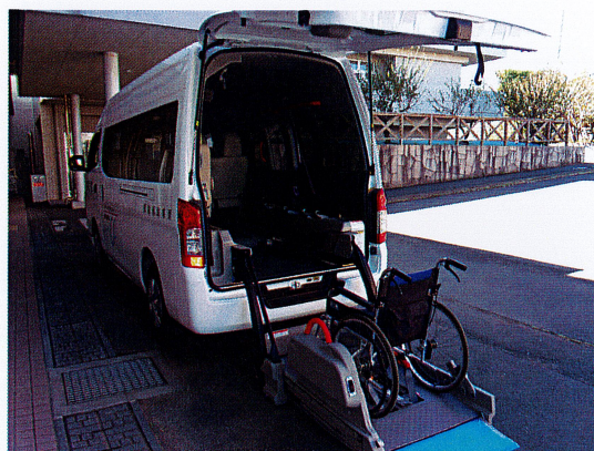
乗車したまま車椅子をリフトで乗せる事ができます。