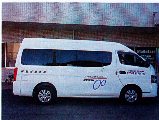
日産キャラバン側面です。

移送車3 [車椅子仕様 (リフト式)] http://www.sukoyakavillage.com