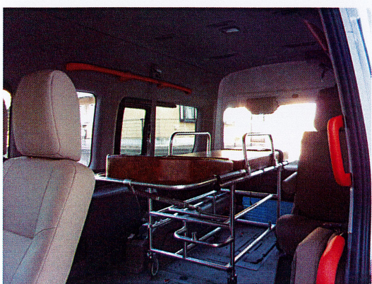
ストレッチャーを乗せる事ができ、緊急搬送も可能です。